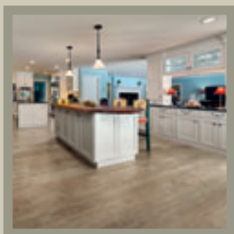
Aspen Natural 14-15