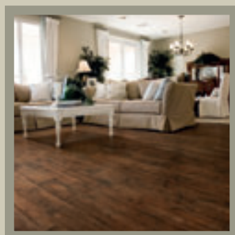
Aspen Cherry 8-9