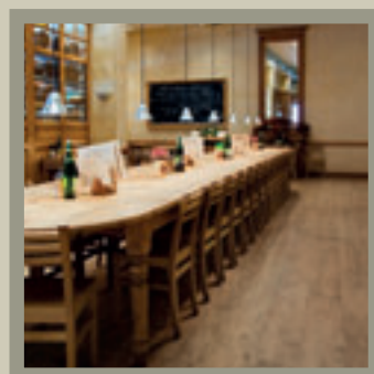
Aspen Sunset 12