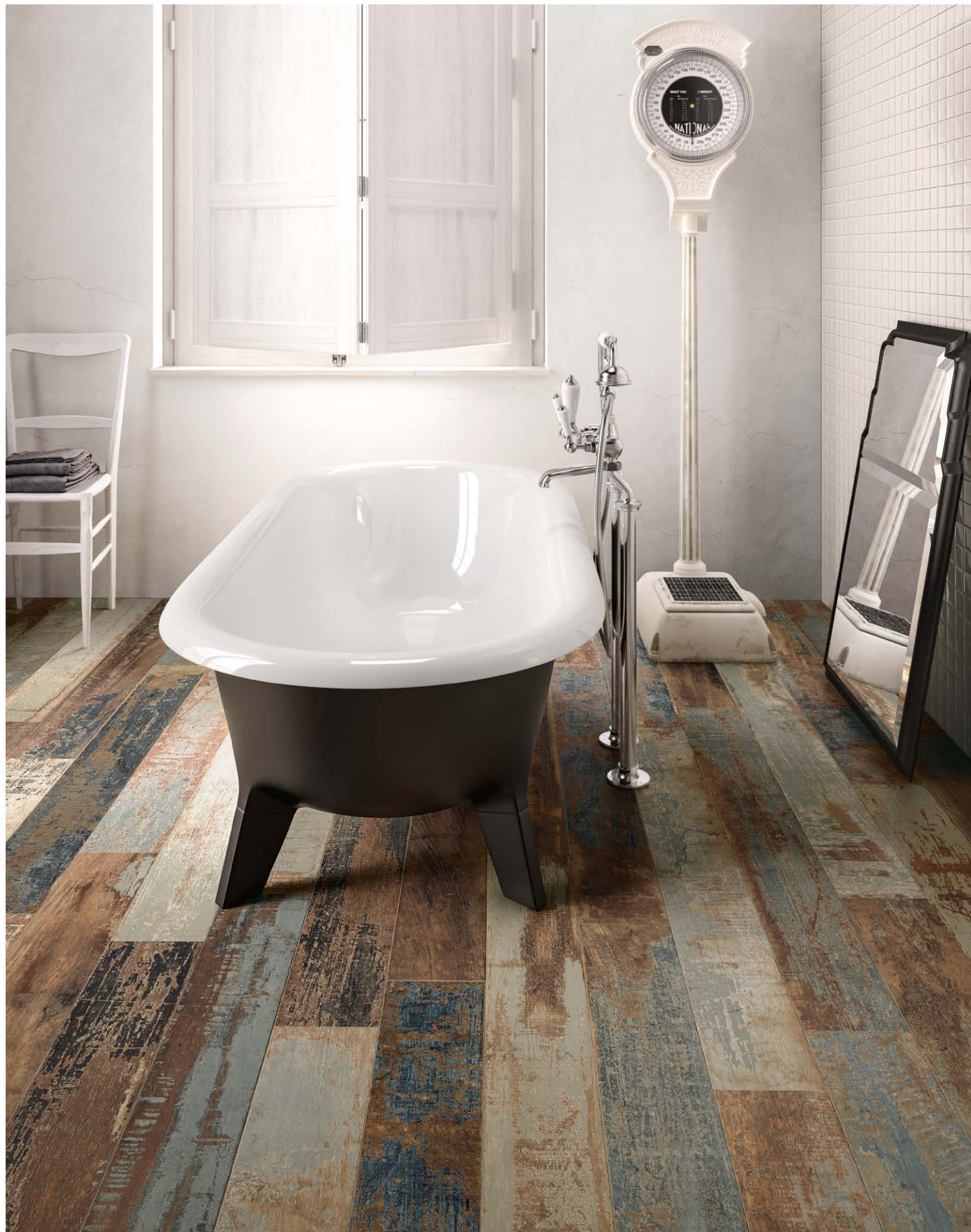
Colorart Navy 15120 Wall / Moda Bianco (ABITA Collection)